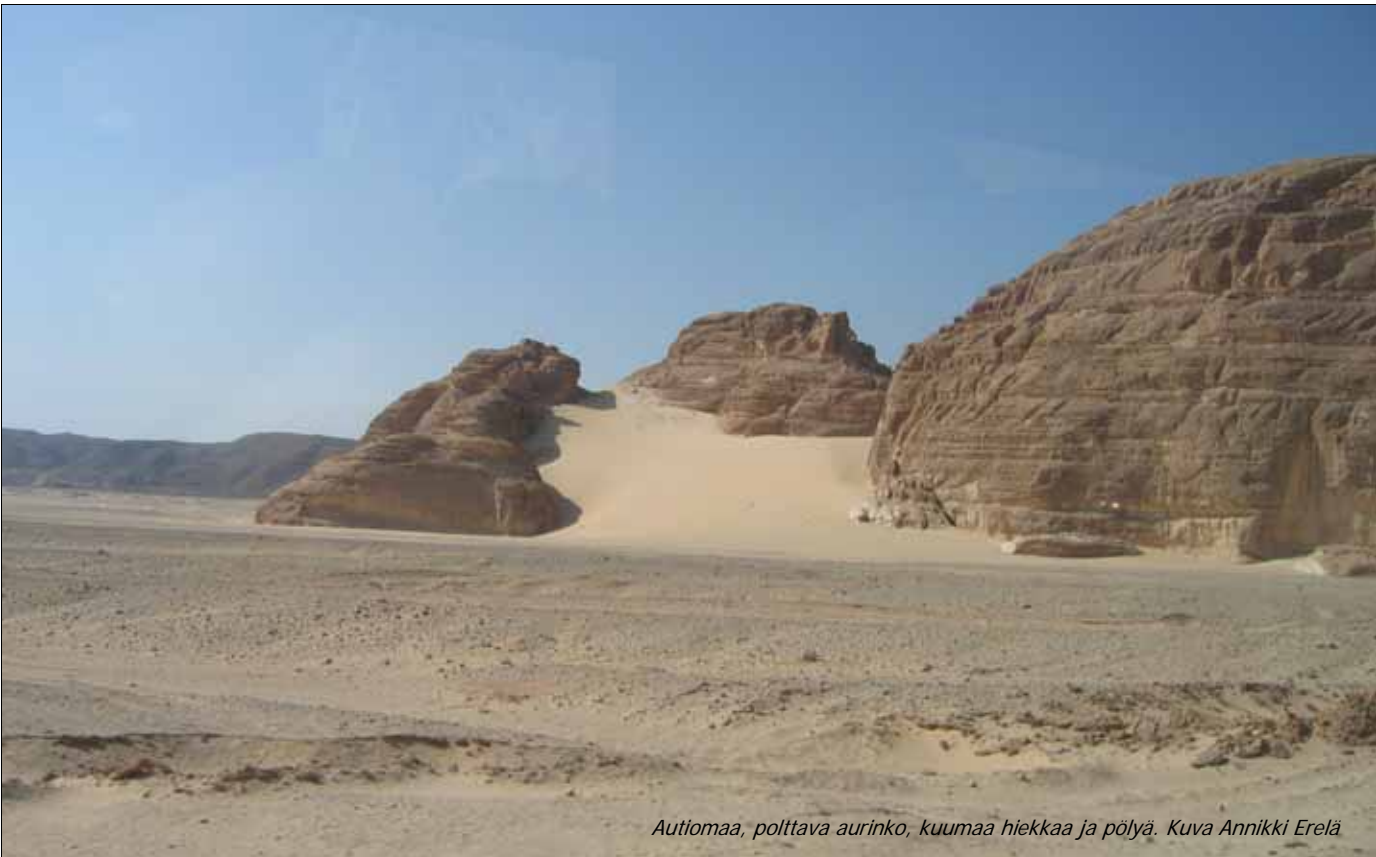
Autiomaa, polttava aurinko, kuumaa hiekkaa ja pölyä.

- Herra siunasi minun työni Harranissa, Jaakob ajatteli. Hänelle oli kertynyt hyvin paljon omaisuutta, niin että Laban oli alkanut kadehtia häntä. Lopulta Jaakob ei ollut enää kestänyt appensa mielivaltaa vaan oli paennut hänen luotaan perheineen, palvelijoineen ja karjoineen. Mutta sitä Jaakob ei ollut tiennyt, että Raakel oli ottanut mukaansa isänsä jumalankuvat.