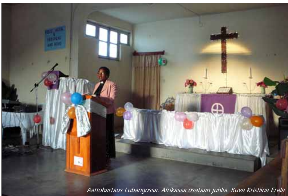
Aattohartaus Lubangossa. Afrikassa osataan juhliä.