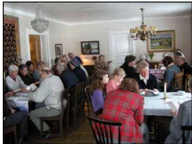
Siionin Kannel -seurat Hauhon Ilmoilassa.

Laula kanssani tapahtumia jatketaan, mm. Kälvillä tammikuun tapahtuma on jo perinteinen.