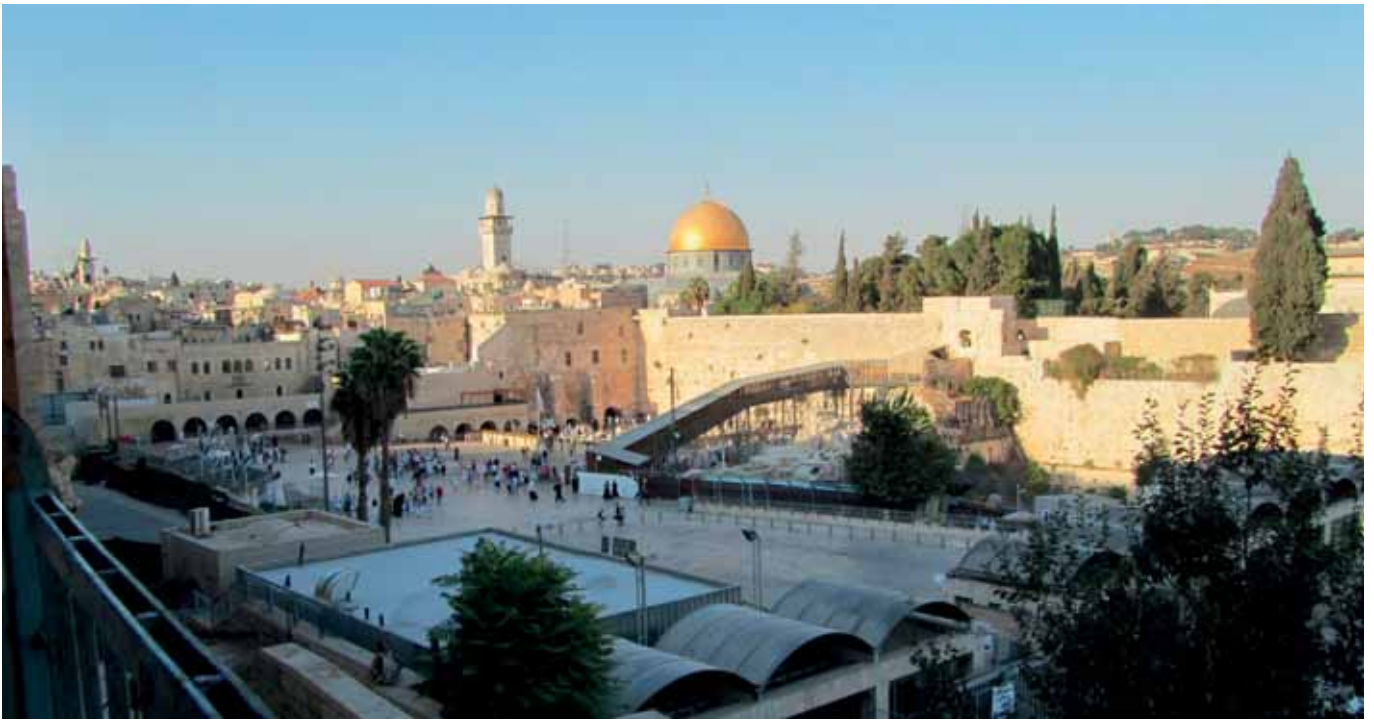
1. Yleiskuva Jerusalemistä