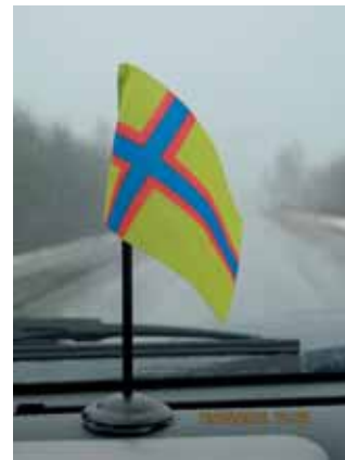
Sinun turvasi on ikiaikojen Jumala, sinua kantavat ikuiset käsivarret. 5.Moos. 33: 27.

luotetaan, että Herra on varannut myös kaikille matkalaisillemme siunauksensa ja varjeluksensa. Muistetaan erityisesti kahden Andrein lähtöä mukaamme. Pienet ja vähän suuremmatkin ylimääräiset pika-arpajaiset voitte osoittaa Venäjän työlle AT / AS -korvamerkinnällä. Uskon, että saamme myös heidän kauttaan iloita yhteisistä Raamatun maan näkymistä ja kohtaamisista siellä. Saamme opintomatkan syvemmälle Raamattuun ikään kuin Jeesuksen askelissa. Tietysti rukoilkaa niin koko ryhmän, matkan ja matkaoppaiden kuin myös matkanjohtajan, -siis minunkin puolestani. Rukouksella ympäröity matka saa varmasti olla siunattu matka!