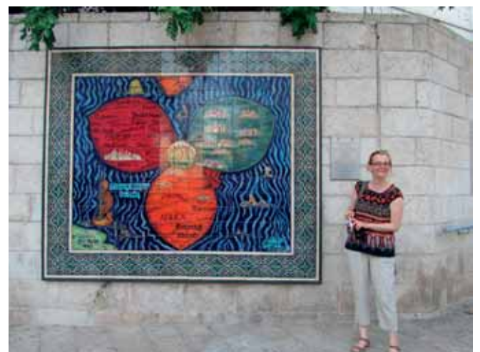
2. Jerusalem – maailman keskipiste

Islamilaisien Kalliomoskeijan kupoli loistaa vanhan kaupungin sydämessä, Jerusalemin temppelin paikalla. Ainoa jäljellä oleva osa v. 70 hävitetystä juutalaisten temppelistä on itku-muuri, joka on nyt juutalaisten pyhin paikka ja jossa käydään rukoilemassa. Monet rukoukset sisältävät todennäköisesti pyyntöjä, että Israelin Jumala ottaisi herruuden maan päällä.