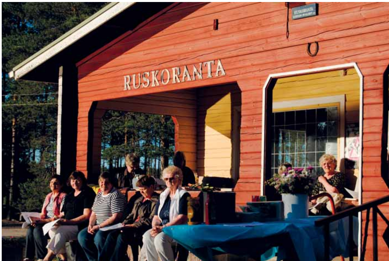
Ruskorannan päärakennuksen edestä.