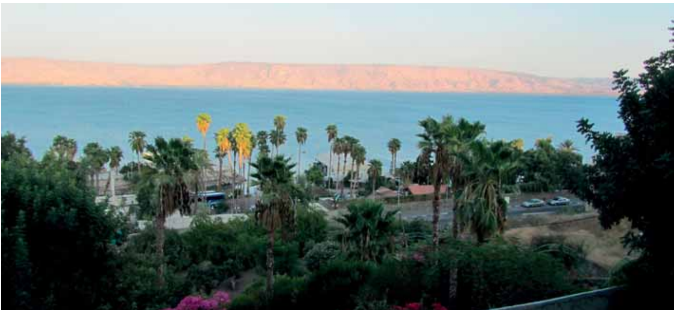
6. Näkymä Gennesaretin järvelle majapaikastamme Tiberiaassa