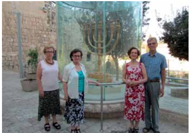
3. Uuden temppelin esineitä valmistetaan

Ilmestyskirjassa on Johanneksen näky uudesta Jerusalemistä. Johannes sanoo: ”Temppeleitä en kaupungissa nähnyt, sillä sen temppelinä on Herra Jumala, Kaikkivaltias, hän ja Karitsa.” (Ilm 21:22)