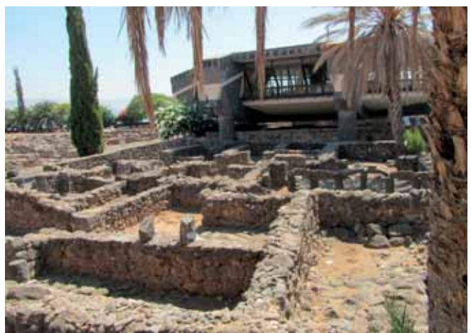
4. Kapernaumin raunioita