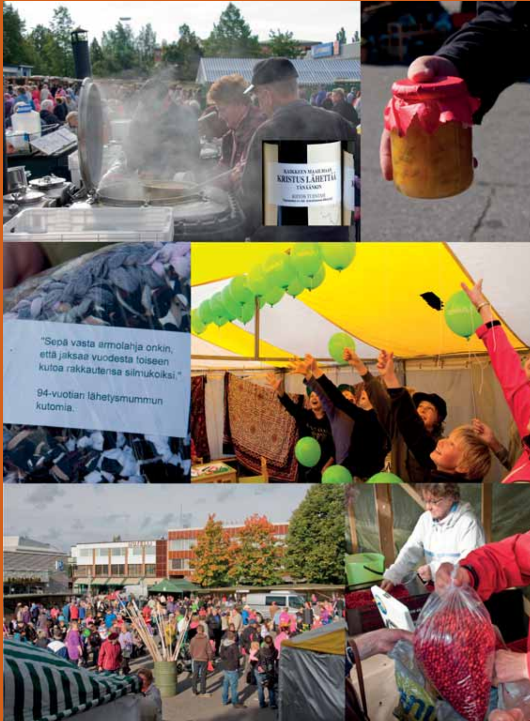
Sastamalan seurakunnan lähetystori Vammalassa 2012.

Jumalan lahjaa on sekin, että ihminen saa vaivannäkönsä keskellä syödä ja juoda ja nauttia elämän antimista.