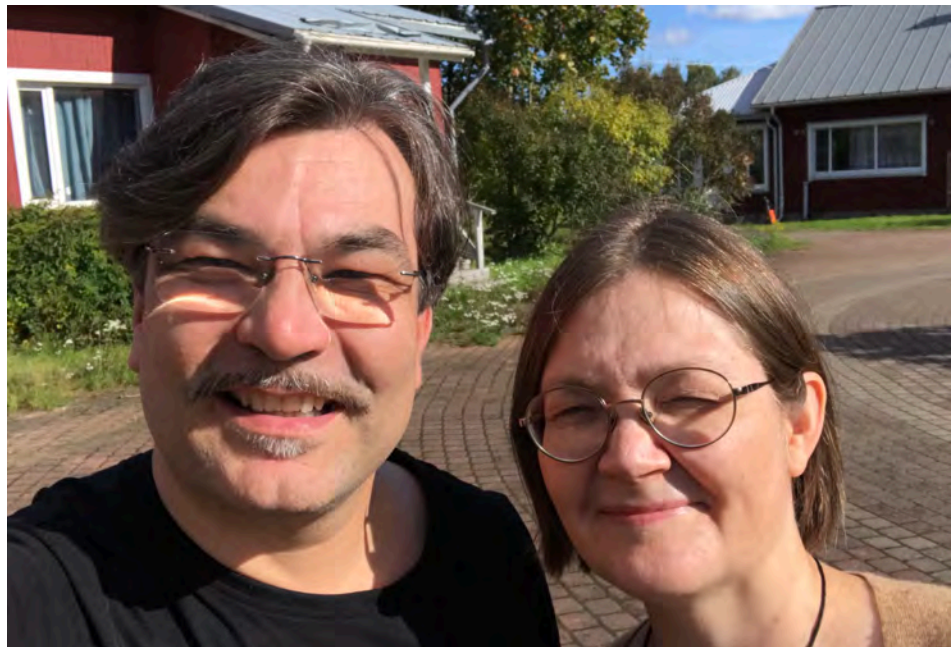
Keltossa valmistautumassa musiikin ja rukouksen iltaan.