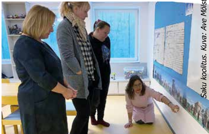
Saku koolitus.

Jokaisella lapsella on oikeus tutustua Jumalaan oman kehitystasonsa mukaisesti ja saada vastauksia elämän suuriin kysymyksiin. Näin lapsi voi pikkujalja muodostaa oman suhteen Jumalaan. Lapsen ohjaamiseen tällä tiellä rohkaisemme sekä työntekijöitä että vanhempia.