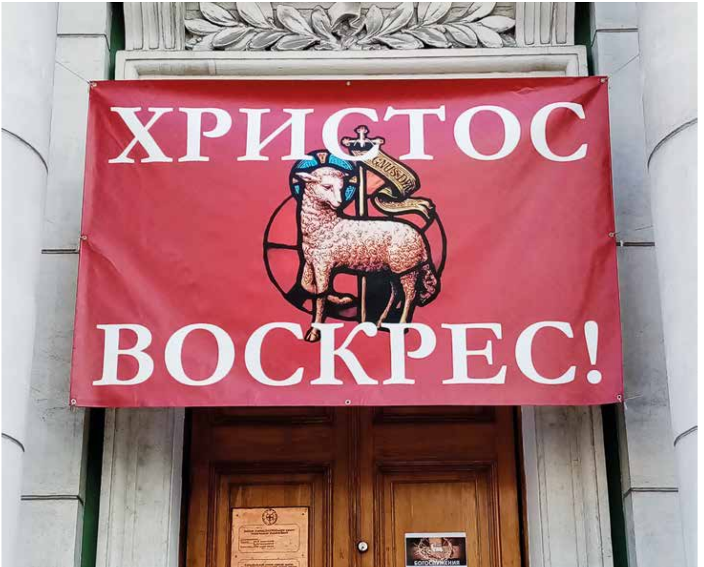
Kristus nousi kuolleista! Pyhän Marian kirkko.

Yhä syvemmin ymmärrämme, että on yksi Vapahtaja, koko maailma on autuas. Ei ihmisten sydämiin voi rakentaa rajoja.