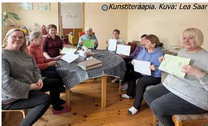
Kunstiteraapia.