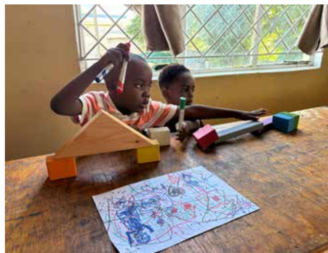
Opetusta kuuntelemaan tultiin myös lasten kanssa. Lapset leikkivät Lean opetusvälineillä, parisuhteen palikoilla.