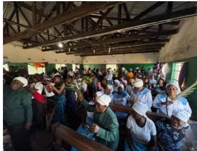
Sunnuntain jumalanpalvelus kesti kokonaista kuusi tuntia. Kuorolaulun lomassa kerättiin kolehtia jokaiselle kuorolle ja lopuksi vielä seurakunnalle.