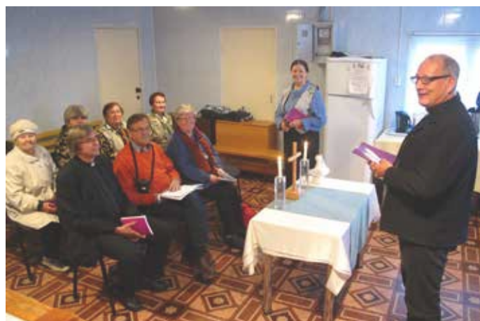
Vienan Karjalassa ystävien seurassa.