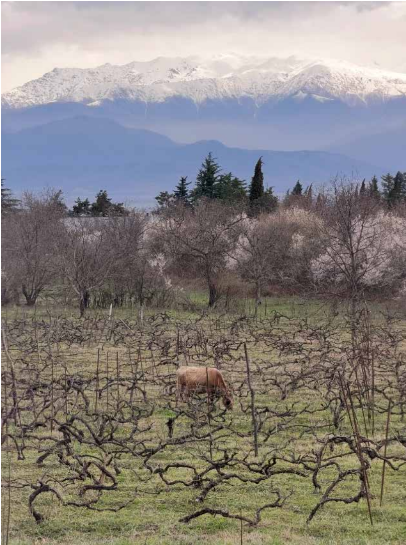
Konferenssi järjestettiin Ikalton kylässä lumihuippuisten vuorten keskellä viinitarhojen täyttämässä Alazanin laaksossa.