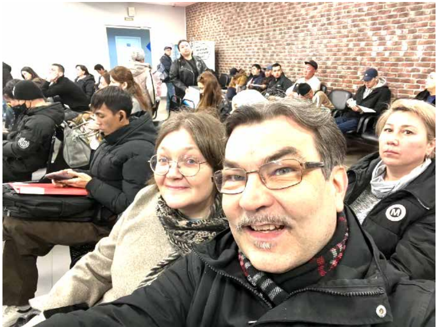
Me ja muut maahanmuuttajat maahanmuuttovirastossa.