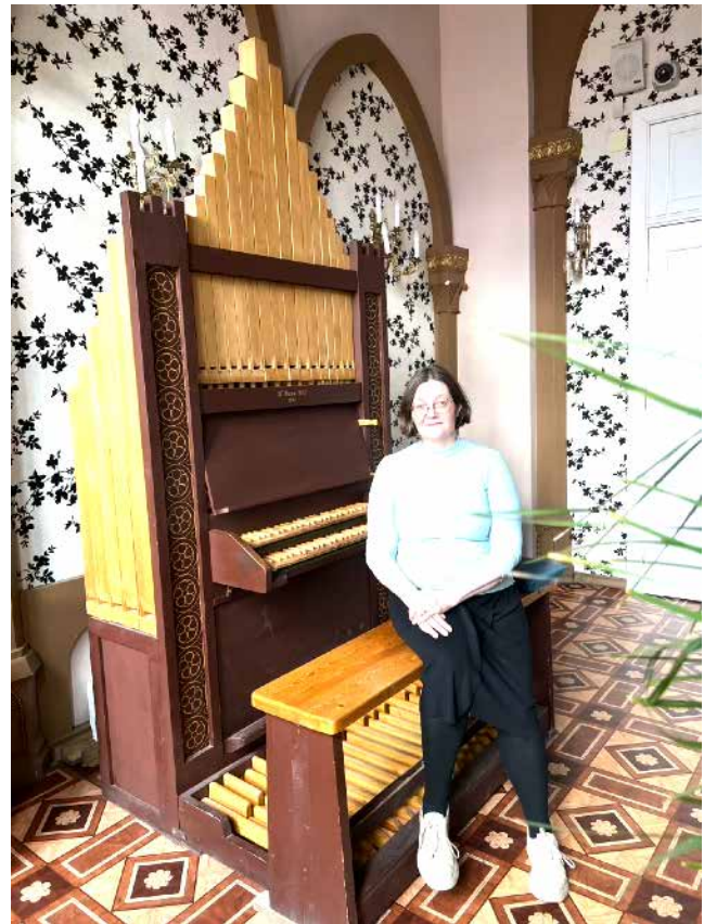
Anu rakkaan harrastuksen parissa pietarilaisella musiikkikoululla.